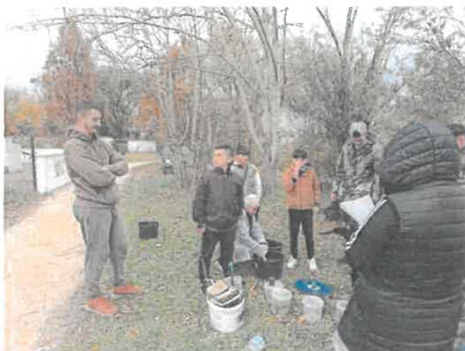
2. ábra: Állományfelmérő gyerek horgászverseny a Ligeti-tavon

A 2025-ös év vége felé közeledve egy gyerek horgászversennyel egybekötött állományfelmérő horgászatot szerveztünk.