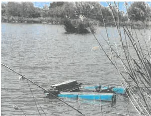
1. ábra: A levegőztető berendezés beszerelve a Ligeti-tavon.