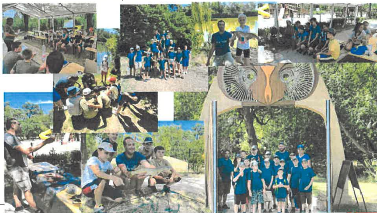
Túrkevei Sporthorgász Egyesület

A horgászturizmust erősítő helyi együttműködés keretében a gyerekhorgászok felkészítését és nevelését a Szent István Katolikus Általános Iskola és Óvoda intézménnyel megállapodást kötöttünk, ahol a horgász szakkör megszervezését és működtetését, ill. a horgászvizsgára való felkészítést fogjuk megvalósítani, a veszélyhelyzet elmúlását követően. Ugyan csak a horgászturizmussal kapcsolatosan, továbbra is szoros kapcsolatot és együttműködést tartunk fent a Túrkevei Sporthorgász Egyesülettel (kírárs 15. pontja) .