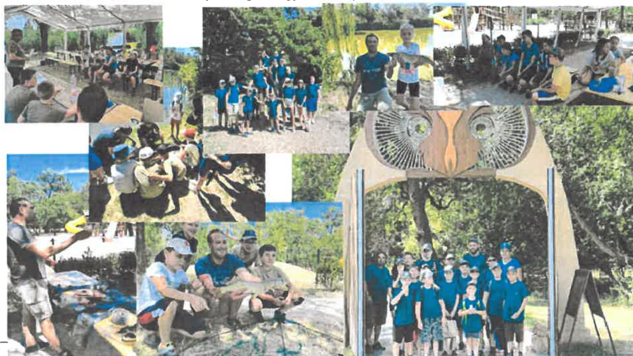
Túrkevei Sporthorgász Egyesület

A horgászturizmust erősítő helyi együttműködés keretében a gyerekhorgászok felkészítését és nevelését a Szent István Katolikus Általános Iskola és Óvoda intézménnyel megállapodást kötöttünk, ahol a horgász szakkör megszervezését és működtetését, ill. a horgászvizsgára való felkészítést fogjuk megvalósítani, a veszélyhelyzet elmúlását követően. Ugyan csak a horgászturizmussal kapcsolatosan, továbbra is szoros kapcsolatot és együttműködést tartunk fent a Túrkevei Sporthorgász Egyesülettel (kírárs 15. pontja) .